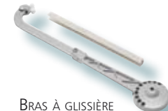
BRAS À GLISSIÈRE